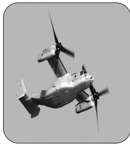
日本の空をわがもの顔で飛ぶオスプレイ