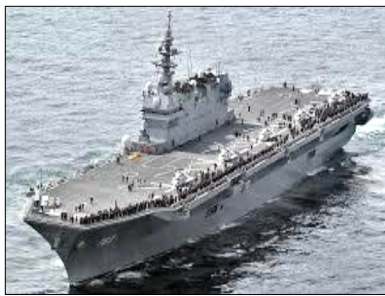
事実上の空母「いずも」

4月8日、一斉地方選挙 が終わるやいなや、京都市 が自衛隊京都地方協力本部 へ、2019年度に18歳・ 22歳になる市民2万660 1人分の個人情報（住所・ 氏名）を宛名シールで提供 しました。自らの個人情報 が提供される若者、市民有 志、弁護士団体、教育関係