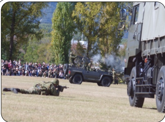
この場所が戦場に？ 桂自衛隊の公開訓練

日本国民は、国家の名誉にかけて、全力をあげて崇高な理想と目的を達成することを誓う。