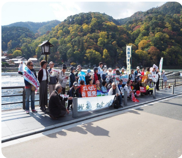
解散地点・ご苦労様でした。