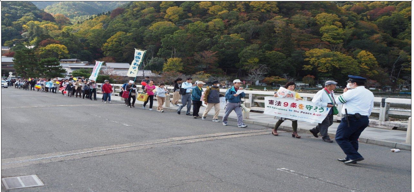
渡月橋を渡ります