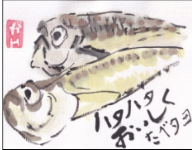
絵手紙 原口 薫

6月のお誕生日会 日時：6月27日(月) 13:30~15:00 7月のお誕生日会 日時：7月25日(月) 13:30~15:00 場所：ほっこりサロン 山陰街道三ノ宮交差点東南角・ハイツ三宮1階 交通：市バス 西2・西5・西6・西8 三宮街道下車 お茶とお菓子でお喋り・ゲームなど 主催：年金者組合西京支部