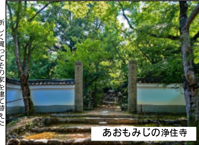
あおもみじの浄住寺

観光コースの途中、唐櫃越えの入り口辺りに古いお地藏さんの祠の様なもの。二昔程前にもなるが、私の住む町内に古くからのお地藏さんをその一角に祀っていた家が売られた。 お地藏さんの祠がどこにも見当たらない。