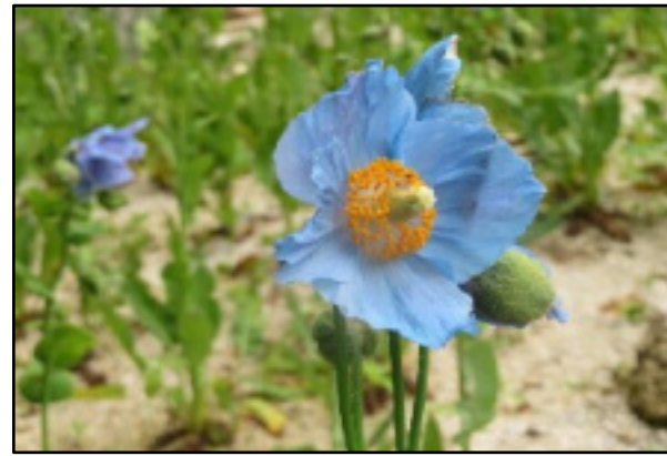
ヒマラヤの青いケシ