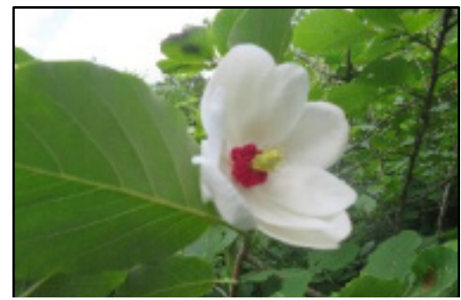
オオヤマレンゲ (六甲高山植物園)

所得税を免除し、社会的弱者が多負担し、逆進性が強い消費税のみが充当される極めて不当・理不尽な仕組みについて、減税を提起する側、及びそれを報道する側を含め、誰からも指摘されず素通りです。