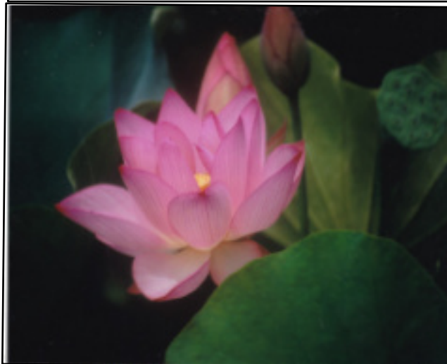
三室戸寺の蓮 山田喜彦