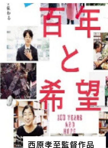
西原孝至監督作品

上映館 京都みなみ会館 九条大宮東入 近鉄東駅駅前 上映日程 7/8 (金) ~ 7/14 (木) 10:00~ 7/15 (金) ~ 7/21 (木) 12:00~ 22日以降は当館へお問い合わせを 京都みなみ会館 TEL: 075-661-3993