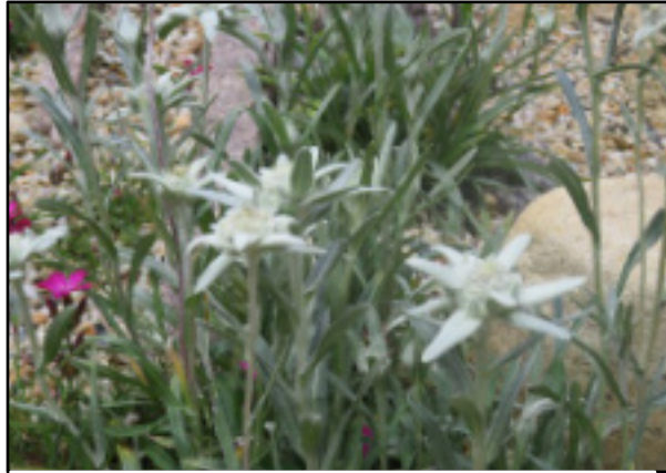
私の見たかったエーデルワイス