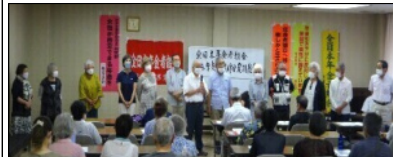
第19回定期総会で選出の新役員の紹介