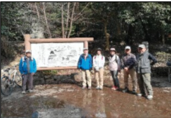
天保義民の説明パネルの前で 幕府の重税に反対して野洲や甲賀の数万の百姓が立ち上がりました