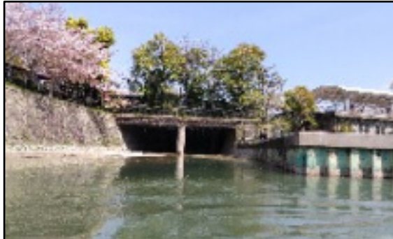
動物園のこの暗渠が白川の出口

白川は比叡山から流れ出て、山中町をとり銀閣寺の哲学の道の疎水の下を潜って(サイフォンという)南下し、岡崎に流れてくることは知っていましたが都会の川は暗渠になっっている事が多いので。