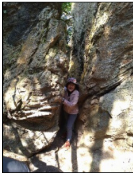
割岩をすり抜ける