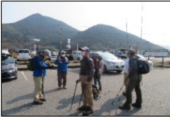
御神社駐車場から出発 左が三上山、右が女山です

朝9時に境谷大橋バス停に集合して、車で滋賀県野洲市の御神社駐車場に到着。道しるべに従い、まず天保義民碑に向かいます。ここからは、岩場が続く険しい道になります。頑張つて登り、展望台に着きました。展望台は岩場が平らになった気持ちのよいところで、此処は西に開けており、野洲市の街並み、守山、草津の街。琵琶湖の湖面が光り、比叡山を右に、左の方に音羽山、千頭岳。金勝山、その左に阿星山までの山並みが続く絶景でした。もう少し登れば山頂でした。山頂は樹林で、展望はありませんが、少し広場になっており、ベンチもありました。ここで昼