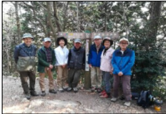
三上山山頂 (432m) にて