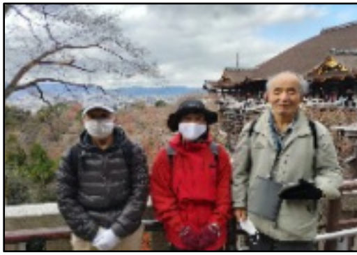
清水寺 阿弥陀堂より、絶景!

鳥辺山妙見宮では妙見大菩薩がまつられており、赤い大きなモミジが未だ残っていて、美しく迎えてくれました。遠くは左大文字・愛宕山・丸山・吉兆山・沢山の三山も見えました。鳥辺