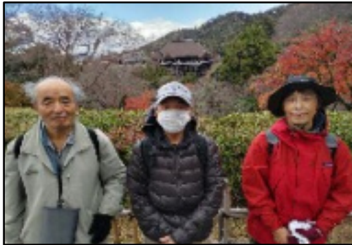
清水子安の塔から舞台を望む

「道はただ一つその道をゆく」故蟠川虎三氏の言葉の碑があり、私たち京都北部周辺の新採教員を集めて励まして下さったこと