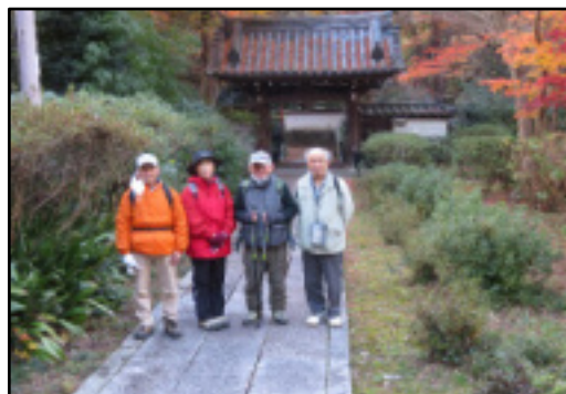
泉湧寺来迎院の境内にて

12月半ばで寒い日でしたが所々に黄色や赤のモミジがまだ残っていて目を和ませてくれました。帰りは順調に市バス・地下鉄に乗れて3時40分に家に着きました。公共交通を使っ