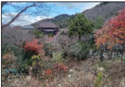
清水はここからが一番の絶景

音羽の滝から石段を登り釈迦堂・阿弥陀堂・奥の院に向かいます。舞台を右手に京の街並みや西山が望める絶景ポイントで