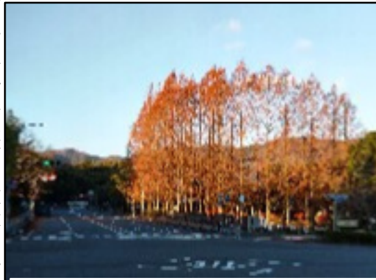
メタセコイア 福西本通りから