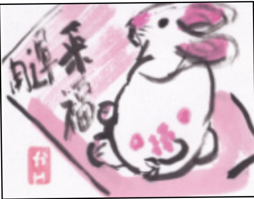
絵手紙 原口 薫

が。唯一お役に立っている「お助け隊」の植木の剪定には脚立、高枝切バサミと大きな道具がいる。植え替え、その土、肥料の購入もこれらは今の私の楽しみでもある。これを奪われる。免許の更新は今年六月である。確かに高齢ドライバーの事故が大きく報じられ、認知症がそれを大きくすると報じられている。高齢