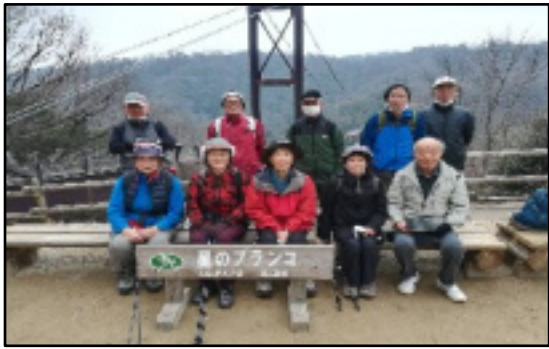
星のブランコに到着

出発直後に小雨がパラパラとありましたが、曇り空の下でのハイキングとなりました。京都縦貫道、第2京阪道路の高速を利用して45分程で着きました10時です。凄く速い、何故なら電車で行く、最寄りの駅、私市から徒歩40分かかります、バスは土、日、祝日のみしか運行し