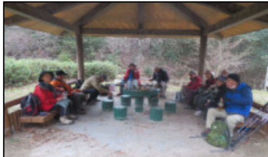
やまびこ広場で昼食

平成9年に園地のクライミングウォールが大阪国体の会場になり、記念事業として星のブランコ (吊り橋) が作られました、星のブランコという呼び名は、交野市の七夕伝説が元だそう