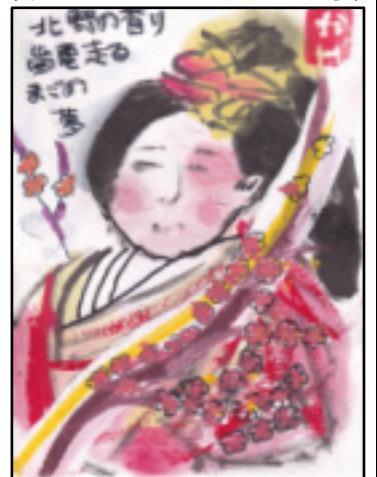
絵手紙 原口 薫

脱原発の闘いをさらに強めようと、決意を新たにしました。集会後、京都市役所まで脱原発を市民に呼びかけデモ行進しました。（大橋歳彦）