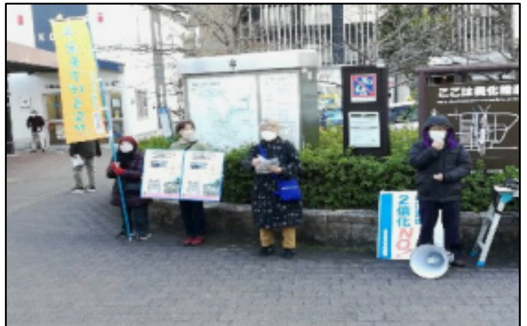
2月25日、阪急桂駅西口宣伝の様